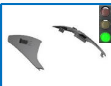
Voir toutes réf page suivante – see all item codes next page