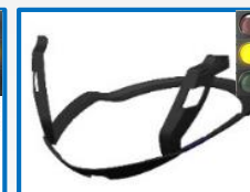
JO9420P – JO9425P