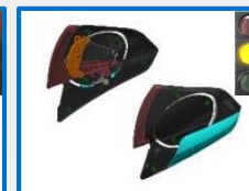
FX9464P – FX9469P