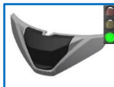
Voir toutes réf page suivante – see all item codes next page