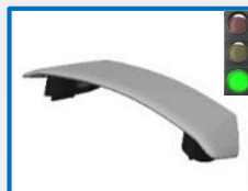
VE9480P – VE9482P