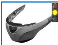
Voir toutes réf page suivante – see all item codes next page